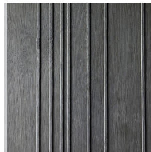
Kastanie Grau Echtholzfurnier